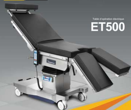
Table d'opération électrique ET500

Bien Vendu Pendant 40 Ans Dans Le Monde Répondre aux exigences fondamentales de la chirurgie générale