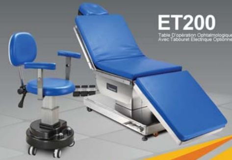
Table D'opération Ophtalmologique Avec Tabouret Electrique Optionnel