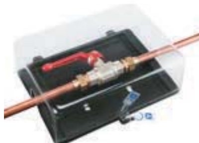
Vanne avec coffret plombable